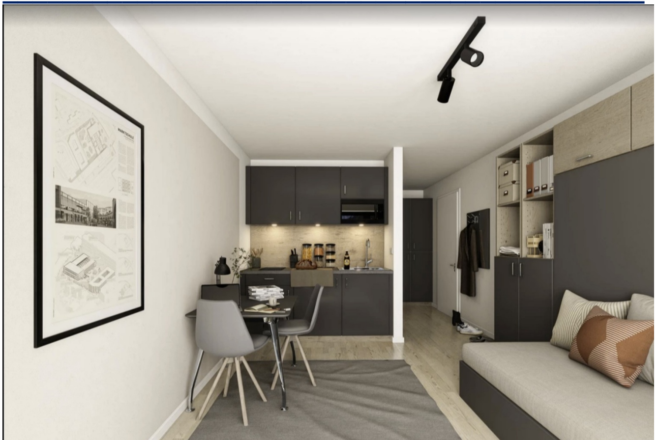
Muster-Einrichtungsfotos. Die Ausstattung kann von Appartement zu Appartement leicht abweichen.